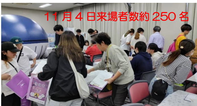
11月4日 来場者数約 250名