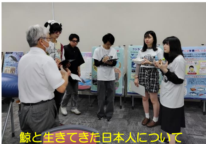
鯨と生きてきた日本人について

◆令和5年度 水産資源の持続的利用に関わる広報事業の一環として鯨食文化普及活動を実施しました。