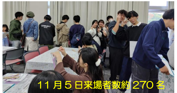
11月5日 来場者数約 270名