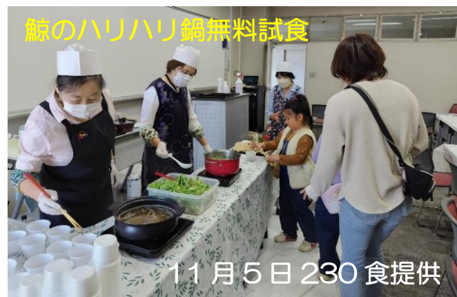
鯨のハリハリ鍋無料試食